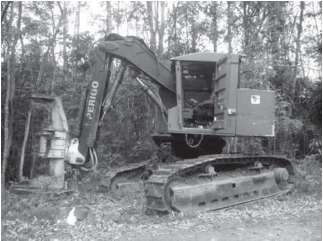
Figura 1. “Feller-Buncher”, marca Timberjack, modelo 608L.

nor para o maior, em relação a algum tipo específico de dimensão corporal.