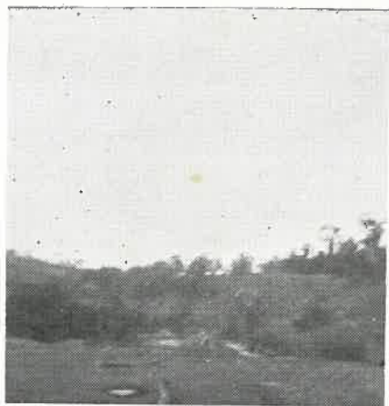
1 — Vista parcial da plantação de perobas de campo do Sr. Guilherme Tomm.