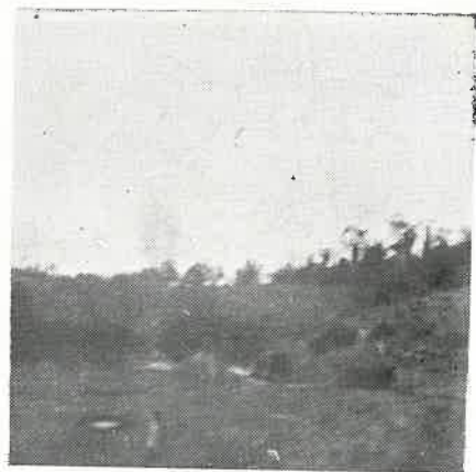
2 — Vista parcial da plantação de perobas de campo do Sr. Guilherme Thomm.