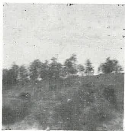
3 — Vista parcial da plantação de perobas de campo do Sr. Guilherme Thomm.